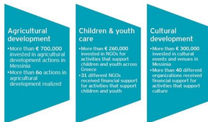
Figure 1 - Captain Vassilis and Carmen Constantakopoulos Foundation activities' overview in the period of 2012-2017

τις επενδύσεις του Ιδρύματος κατά την περίοδο 2012-2017 που σχετίζονται με τις βασικές κατηγορίες δραστηριότητάς του: Αγροτική ανάπτυξη, κοινωνική πρόνοια και η πολιτιστική ανάπτυξη στη Μεσσηνία. Ακολουθεί μια επισκόπηση των επιδόσεων του Ιδρύματος στις βασικές κατηγορίες δραστηριοτήτων κατά την περίοδο 2012-2017: